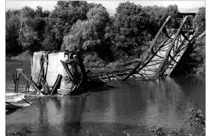
Am 30. Mai 1999 bombardierte die Nato die Brücke in Varvarin, Jugoslawien, tötete zehn Menschen und verletzte 17 weitere teilweise schwer.