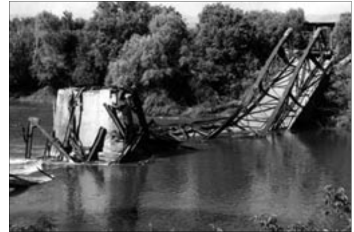
Am 30. Mai 1999 bombardierte die Nato die Brücke in Varvarin, Jugoslawien, tötete zehn Menschen und verletzte 17 weitere teilweise schwer.